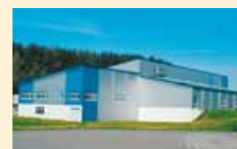
Logistikzentrum am neuen Standort.